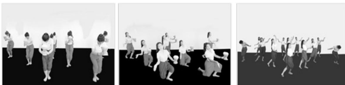
รูปที่ 4 ตัวอย่างท่ารำช่วงที่ 2 ถวายสมมา

ช่วงที่ 2 ถวายสมมา นำเสนอการนำข้าวตอกไปใช้ในการประกอบพิธีกรรม งานมงคลต่างๆ นำเสนอคุณค่า ประโยชน์ของข้าวตอกผ่านการทำท่าทางการถวายของชาวบ้านที่มีความนอบน้อม แสดงความเชื่อ ความศรัทธาของชาวบ้าน ใช้ท่าทางการโปรยหรือการหว่านข้าวตอก สื่อความหมายวิถีชาวบ้านที่มา ต่อมไฮ่มกัน (รวมกัน) ในพิธีกรรมงานมงคล