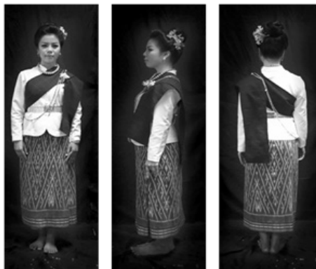
รูปที่ 1 การแต่งกายชุดฟ้อนถวายสมมาข้าวตอกมงคล

• การแต่งกาย ผู้วิจัยได้แรงบันดาลใจมาจากการแต่งกายของชาวบ้านในภาคอีสานแบบชุดเอาบุญ ซึ่งผู้หญิงนิยมนุ่งผ้าซิ่นทอเองคลุม่อง เสื้อนิยมผ้าสีพื้น ใช้ผ้าสไบเฉียงไหล่ บางครั้งก็เปลี่ยนมาใช้หม้อไหล่ พาดบ่าหรือทาบทับไหล่ในการแสดงชุดฟ้อนถวายสมมาข้าวตอกมงคล ผู้วิจัยใช้วัตถุดิบที่มีอยู่ในท้องถิ่นได้แก่ ผ้าฝ้ายทอมือตัดเย็บเสื้อแขนกระบอกสีขาวแทนสีของข้าวตอกที่ชาวบุรีรัมย์ นุ่งผ้าซิ่นฝ้ายสีครามยาวคลุม่อง และหม้อสไบผ้าฝ้ายสีครามลายดอกแก้วสีน้ำเงินสว่าง ทรงผมรวบตึงขดเป็นก้นหอย ทัดดอกป๊อปและสวมเครื่องประดับเงิน เพื่อเพิ่มสีสันให้ชุดการแสดงมีความสวยงาม น่าสนใจ สมบูรณ์แบบมากขึ้น