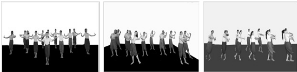
รูปที่ 5 ตัวอย่างท่ารำช่วงที่ 3 มงคลสุขสม

ช่วงที่ 3 มงคลสุขสม นำเสนอผลของการใช้ข้าวตอกเพื่อเสริมมงคลของชาวอีสานที่ยังสืบทอดใช้ต่อกันมาถึงปัจจุบัน ท้ารำเป็นการสื่อให้เห็นถึงเสน่ห์ของหญิงชาวอีสานที่มีความสวยงาม กิริยานุ่มนวล อ่อนหวานที่สอดแทรกความสนุกสนาน หลังจากเสร็จงานซึ่งมักจะนิยมเล่นกันอย่างสนุกสนาน รื่นเริง กระฉับกระเฉงผ่านท่าทางจังหวะที่รวดเร็วและเรียบง่ายตามบทร้องด้วยทำนองลำเตี้ยและลำเพลิน