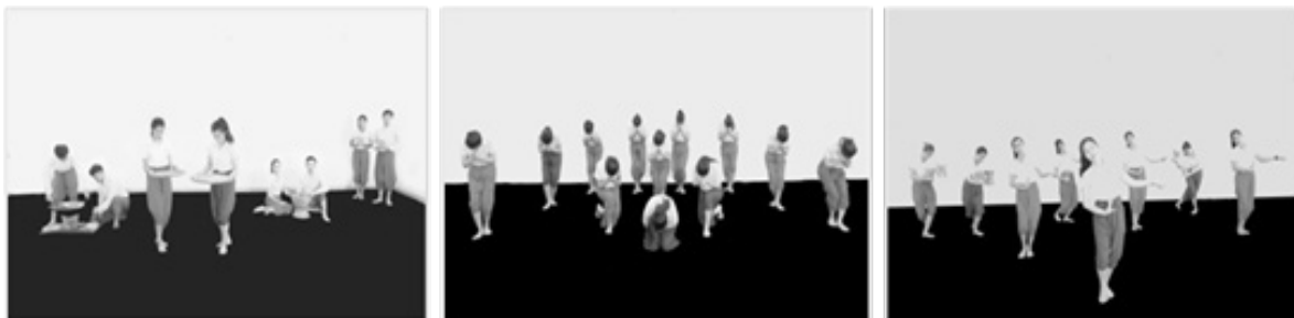
รูปที่ 3 ตัวอย่างท่ารำช่วงที่ 1 วิถีชีวิต

ช่วงที่ 1 วิถีชีวิต นำเสนอวิถีชีวิตของคนอีสานและขั้นตอนในการร่วมแรงร่วมใจกัน ทำข้าวตอกเพื่อนำไปใช้ในพิธีกรรม งานมงคลต่างๆ ท่ารำถูกตีความหมายมาจากท่าทางของคนอีสานที่มีความเรียบง่าย อ่อนน้อมถ่อมตนแสดงขั้นตอนการทำงานร่วมกันสื่อสะท้อนผ่านบทเพลงที่ร้อยเรียงด้วยภาษาลิ้น เรียบง่ายและงดงาม