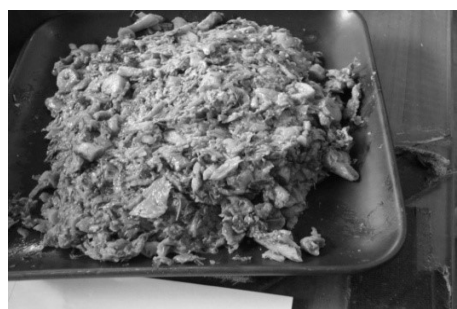
ภาพที่ 4 พะสะ