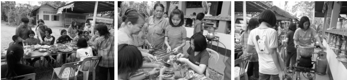
ภาพที่ 5 บรรยากาศการอบรมเชิงปฏิบัติการเกี่ยวกับอาหารพื้นเมืองแบบดั้งเดิมให้คนรุ่นใหม่

ซึ่งแนวทางที่ชุมชนเลือก คือ การเผยแพร่อาหารพื้นเมืองของชุมชนให้ประชาชนทั่วไปรับรู้ รวมถึงการจัดอบรมเชิงปฏิบัติการที่เป็นการอนุรักษ์และสืบสานความหลากหลายด้านอาหารพื้นเมืองของชุมชน โดยเฉพาะอาหารที่ถือว่าเป็นอัตลักษณ์ของชุมชนที่มีมาแต่ดั้งเดิมให้แก่เด็กและเยาวชนของชุมชน เพื่อให้อาหารเหล่านั้นยังคงอยู่ต่อไป