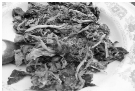
ภาพที่ 2 กะแห่นกะลา