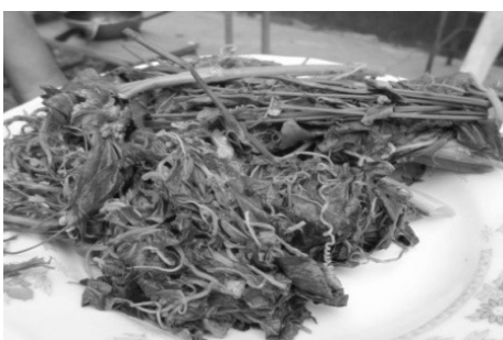
ภาพที่ 3 กลิ่งล่าหื้อซื่อโค