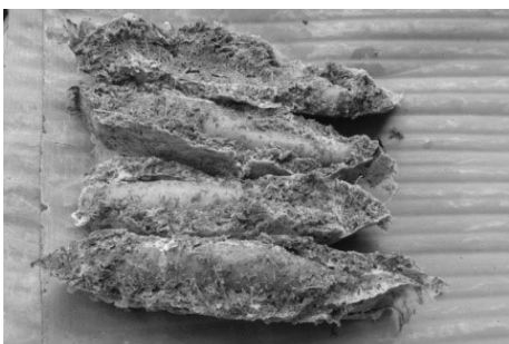
ภาพที่ 1 ก่าปู่แปะ

อย่างไรก็ตามจากการเปลี่ยนแปลงทางสังคมทำให้วัฒนธรรมด้านอาหารของชาวอิมปีประสบกับปัญหาและอุปสรรคสำคัญ คือ การที่เด็กและเยาวชนคนรุ่นใหม่ในชุมชนไม่รู้จัก ไม่สามารถปรุง และส่งผลให้ไม่มีการสืบทอดความหลากหลายทางวัฒนธรรมทางด้านอาหารพื้นเมืองของชุมชน ซึ่งในปัจจุบันรายการอาหารที่ถือว่าเป็นเอกลักษณ์ของชุมชนอิมปีบ้านดงที่ยังคงรับประทานกันอยู่ในวงจำกัด เฉพาะประชาชนวัยกลางคนก่อนไปทางผู้สูงอายุ มีจำนวน 4 รายการ ดังภาพที่ 1-4 โดยแต่ละชนิดมีวัตถุดิบที่หาได้ง่ายตามฤดูกาล และกระบวนการที่ไม่ซับซ้อน ดังตารางที่ 1