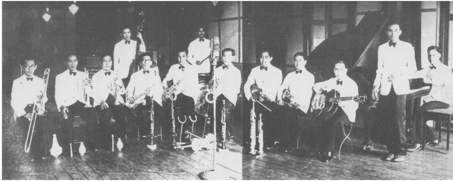
Figure 2 : Band of Public Relations Department in 1939