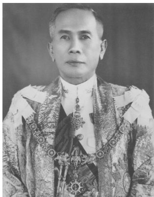
Figure 3 : Field Marshal Plaek Phibunsongkhram